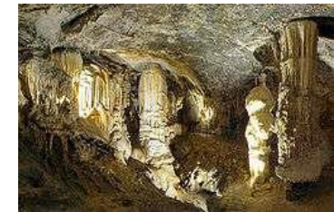
Grotte von Postojna